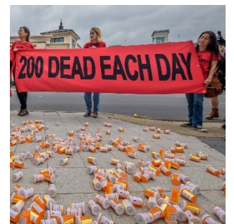
Les informations sur les comptes suisses de la famille propriétaire du groupe pharmaceutique Purdue s'accompagnent d'une critique générale de cette société.