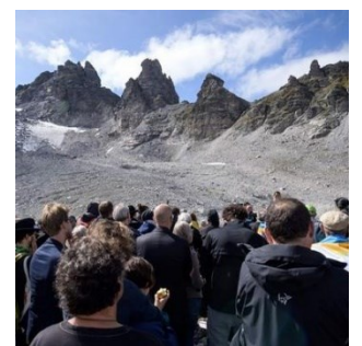
Marche funèbre pour commémorer la fonte du glacier du Pizol