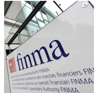
Les articles et reportages sur les monnaies numériques utilisent généralement des icônes et symboles.

En outre, diverses manifestations de protestation d'activistes pour le climat ont attiré l'attention, notamment une manifestation dans le conseil national et des manifestations contre des banques suisses, accusés d'investir dans des industries nocives pour le climat. Sur le même thème, les médias étrangers se sont fait l'écho d'une marche funèbre symbolique organisée pour commémorer la fonte d'un glacier ainsi que d'une conférence internationale de jeunes sur le climat à Lausanne. La presse internationale accorde une certaine place à la gestion de cette problématique par les politiques suisses. Le Conseil fédéral a décidé que la Suisse devait devenir climatiquement neutre d'ici 2050 et la Commission de l'environnement du Conseil des États propose des mesures telles qu'une taxe sur les billets d'avion. Dans les médias étrangers, la Suisse apparaît comme forte d'une société civile active et connectée et d'acteurs politiques conscients du défi que représente ce phénomène.