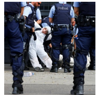
Manifestation contre le Credit Suisse dénonçant ses investissements dans des industries néfastes pour le climat.